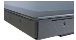
Ganzglasoberfläche Abbildungen ähnlich