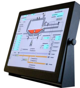
*Abb. können je nach Spezifikation variieren