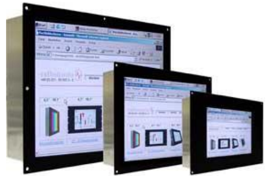
*Abb. können je nach Spezifikation variieren

Geringes Gewicht durch Aluminiumfrontplatte