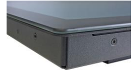
Ganzglasoberfläche Abbildungen ähnlich