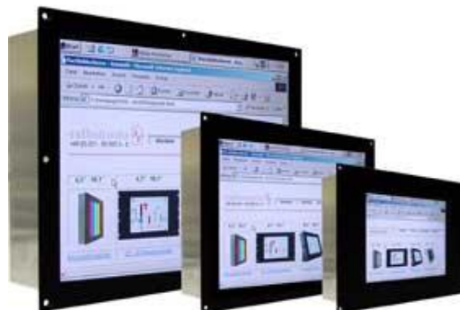
*Abb. können je nach Spezifikation variieren

Geringes Gewicht durch Aluminiumfrontplatte