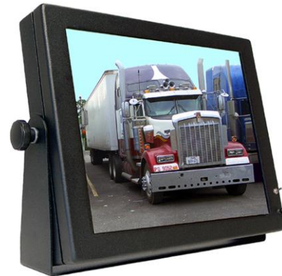
*Abb. können je nach Spezifikation variieren