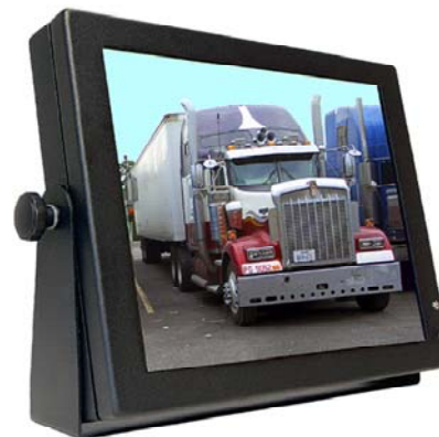
*Abb. können je nach Spezifikation variieren