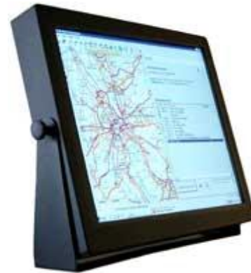
*Abb. können je nach Spezifikation variieren