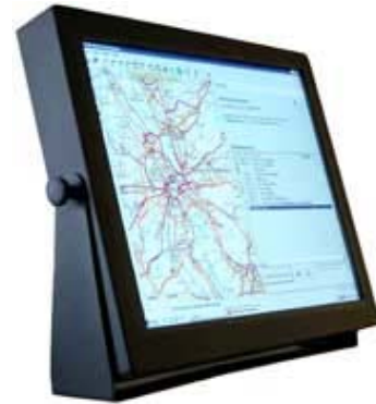
*Abb. können je nach Spezifikation variieren