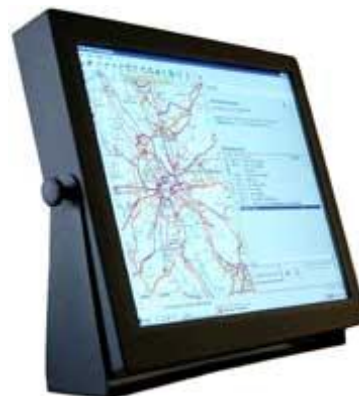
*Abb. können je nach Spezifikation variieren